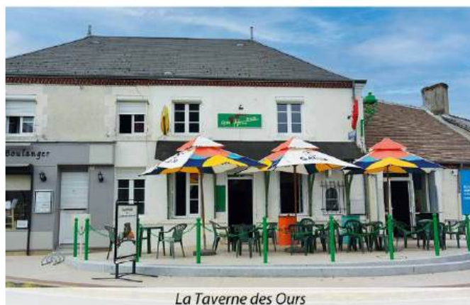
La Taverne des Ours

Offrant les services d'épicerie, de bar-tabac, journaux et Française des Jeux, la Taverne des Ours vient compléter avec bonheur une offre commerciale composée du boulanger-pâtisseries, du salon de coiffure et du salon d'esthétique.