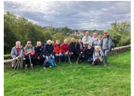
Les gorges de la Boulbe