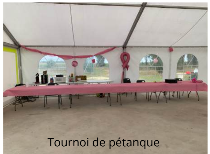
Tournoi de pétanque