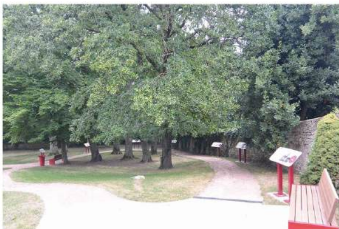
Le parcours archéologique, square de l'Abbé Machard