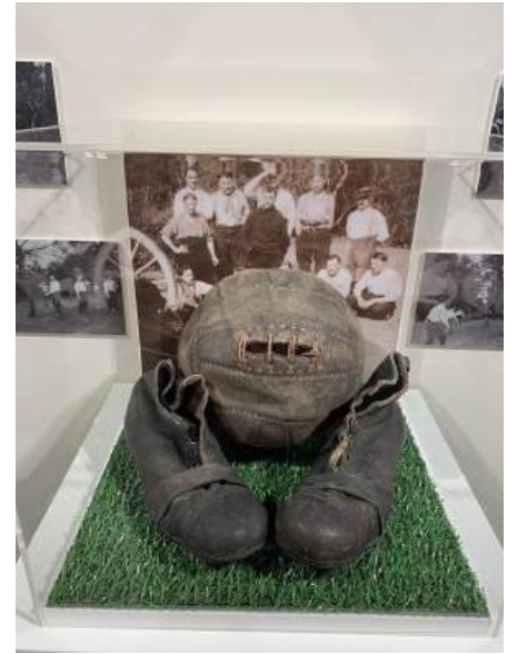
Musée du paysan soldat de Fleuriel