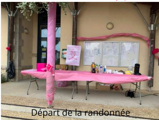
Départ de la randonnée